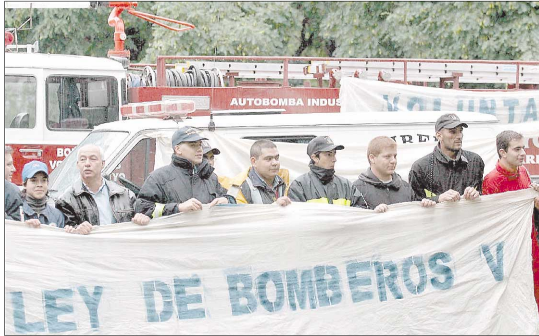
PROTESTA. Representantes de las diez asociaciones llegaron hasta la Casa de las Leyes.

Según datos oficiales, el 65 por ciento de los siniestros que ocurren en Mendoza son cubiertos por los Bomberos Voluntarios.